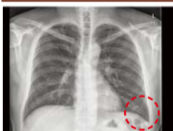
▲ Góc phóng xạ bình thường