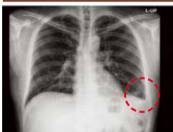
▲ Hình ảnh dị thường của phế nang, xương sườn và màng phổi không bình thường