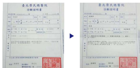
Trước khi cầu nguyện, chẩn đoán mắc chứng sa sút trí tuệ (trái) Sau khi cầu nguyện, không có triệu chứng của sa sút trí tuệ với điểm số CDR 1 (phải)