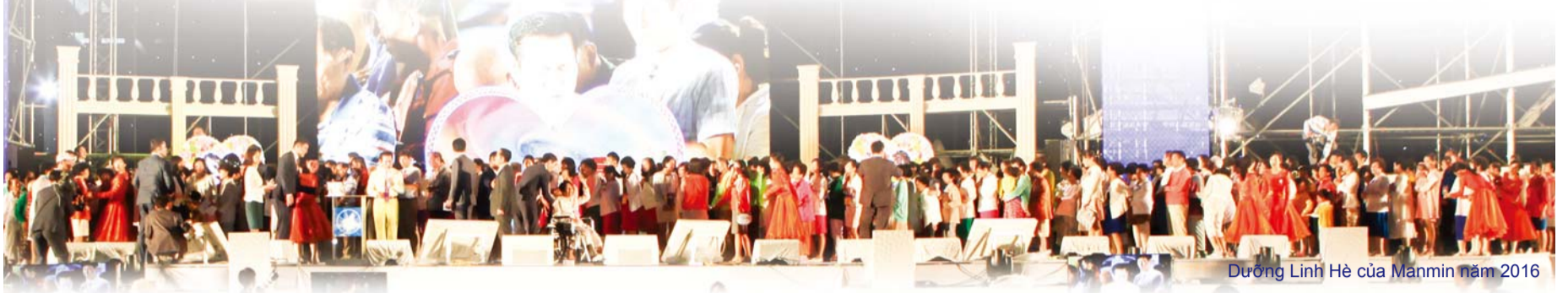
Dưỡng Linh Hè của Manmin năm 2016

Trong kỳ Dưỡng Linh Hè của Manmin được tổ chức vào đầu tháng 8 hàng năm, nhiều người được chữa lành nhiều loại bệnh như AIDS, trầm cảm, đau tim, xuất huyết não, sa sút trí tuệ, và chứng mù. Chúng ta hãy nghe từ những người đã làm chứng về việc được chữa lành của họ.