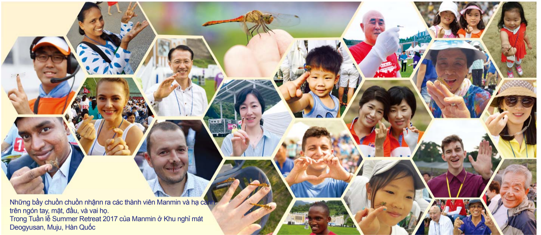
Những bầy chuồn chuồn nhả ra các thành viên Manmin và hạ cánh trên ngón tay, mặt, đầu, và vai họ. Trong Tuần lễ Summer Retreat 2017 của Manmin ở Khu nghỉ mát Deogyusan, Muju, Hàn Quốc