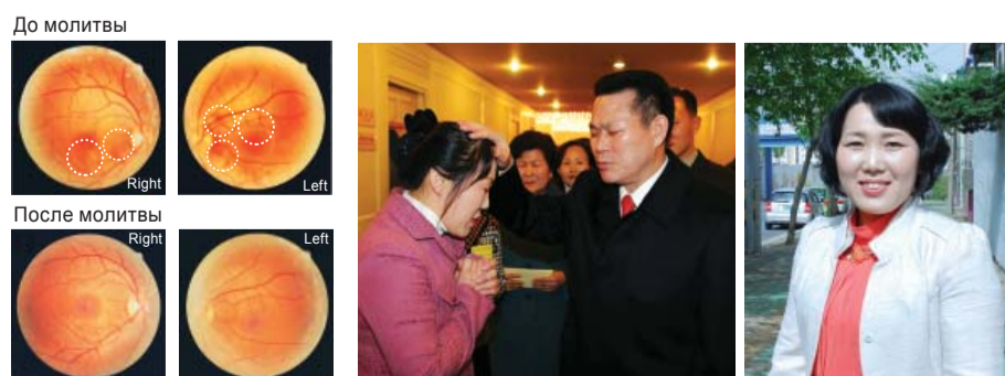
Ретинограф показывает, что киста исчезла. Ее зрение восстановилось и с 0.8/0.25 улучшилось до 1.0/1.0.

После этого зрение ее улучшилось, и все вокруг больше не было мутным. Повторная проверка показала, что у нее нормальное зрение. До молитвы ее зрение было 0.8/0.25, а после молитвы оно улучшилось и стало 1.0/1.0. А вскоре она стала видеть еще лучше, и зрение у нее стало 1.2/1.2. Обычно в госпитале болезнь Харада лечится около шести месяцев, а она была исцелена за две недели. Бог спас ее от слепоты! Это просто поразительно!