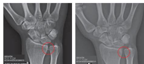
До молитвы: кальцификация После молитвы: отсутствие кальцификации