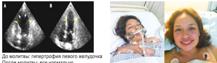
До молитвы: гипертрофия левого желудочка После молитвы: все нормально