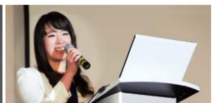
Она свидетельствовала о своем исцелении на 10-й Международной христианской конференции WCDN в Мексике