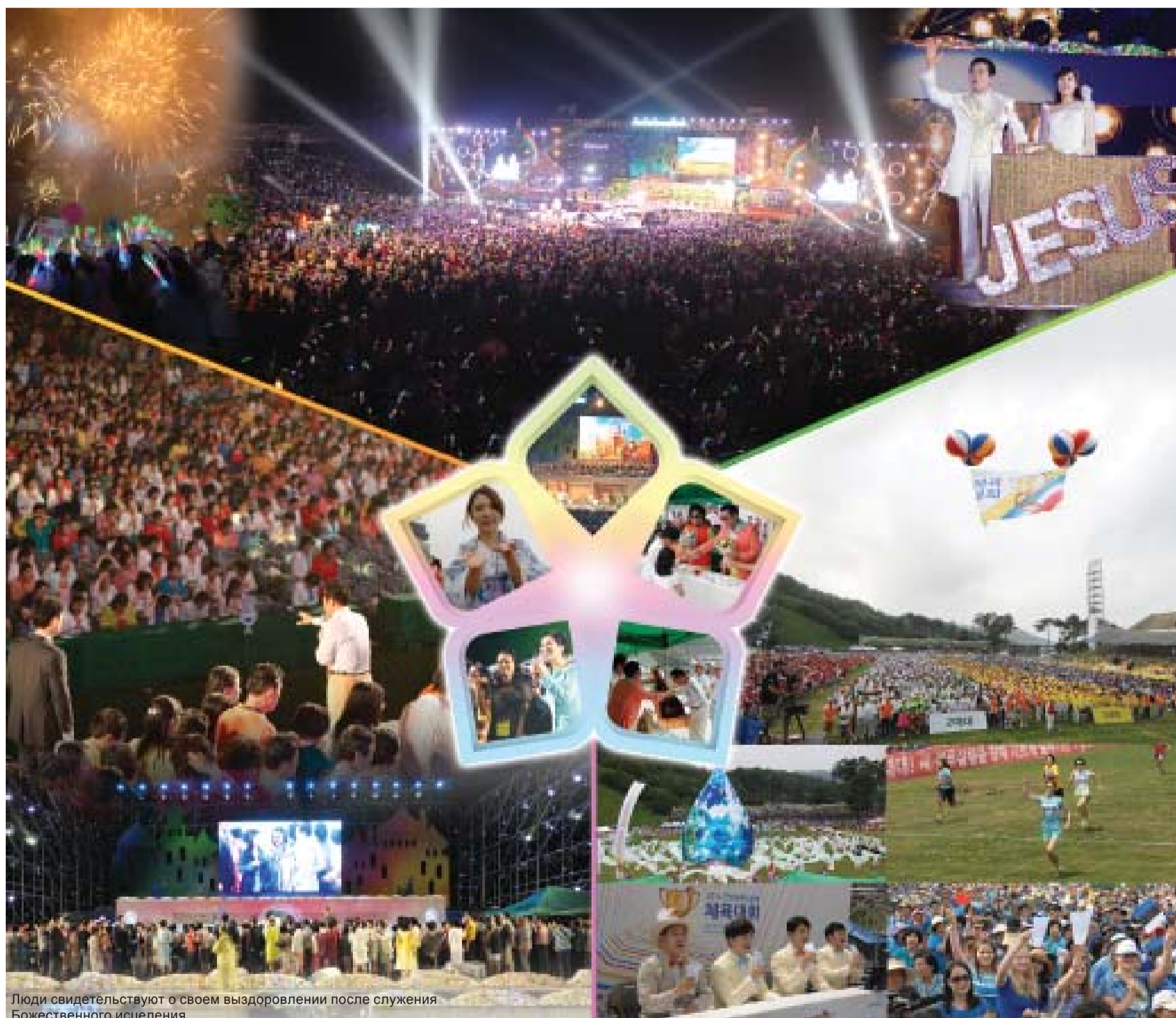
Люди свидетельствуют о своем выздоровлении после служения Божественного исцеления

«Ответы, исцеления и любовь в избытке принес участникам летнего ретрита взрыв силы Святого Духа»