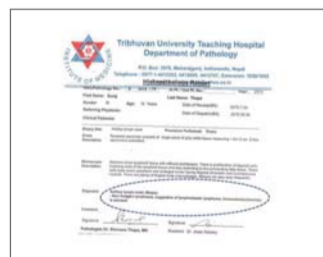
Биопсия лимфатических узлов показала лимфому в третьей стадии

Я воздаю всю благодарность и славу Живому Богу, Который благословил членов моей семьи возможностью обрести спасение через болезнь моего сына.