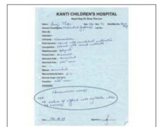
Обследование костного мозга показало, что лимфомы больше нет