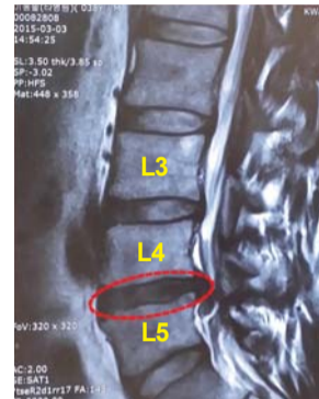
Диск между L4 и L5, пораженный грыжей, давил на нервы