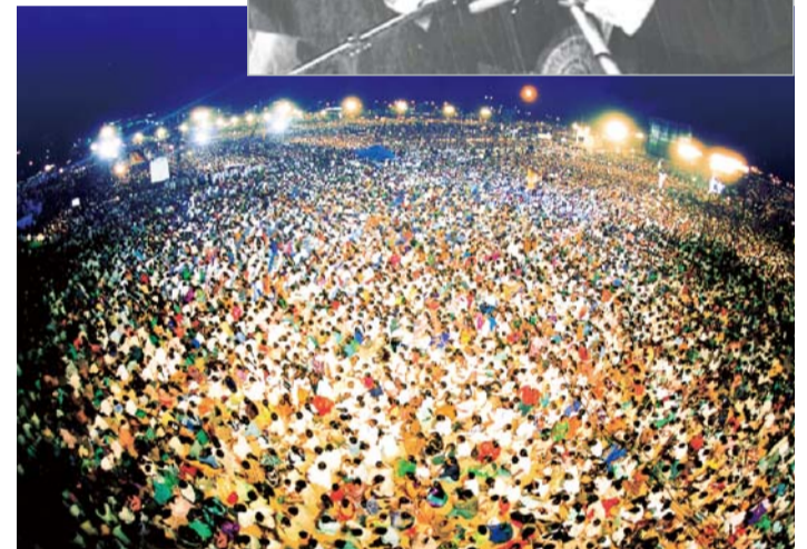
Индийский Объединенный крусеид 2002 года посетили около трех миллионов человек. Во время проведения крусеида сильная засуха прекратилась. Многие люди исцелились и обратились в христианство.