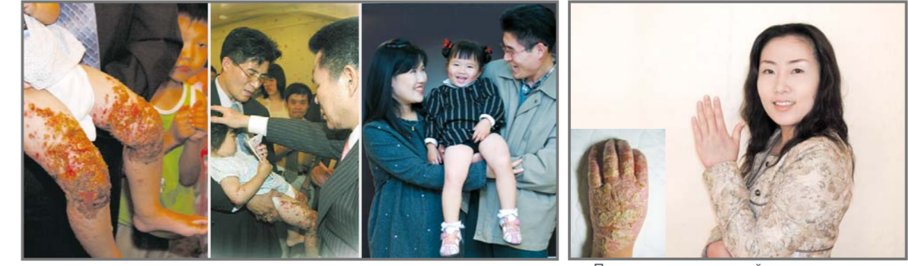
У Йе Чжи Ким кожа стала чистой за три недели молитвы.

Двое из десяти младенцев в Корее страдают от атопического дерматита, и это число растёт.