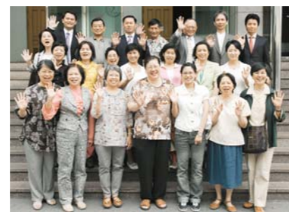
Студенты семинарии Манмин в Тайване посещают Центральную церковь «Манмин».

Узнав о миссии «Свет и соль» для тех, кому приходится работать в День Господень, она была глубоко тронута этим служением и загорелась желанием открыть такую же миссию в Тайване. Сегодня семена веры уже дают свои ростки в нескольких торговых центрах.