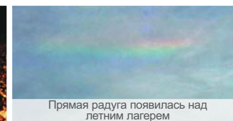
Прямая радуга появилась над летним лагерем