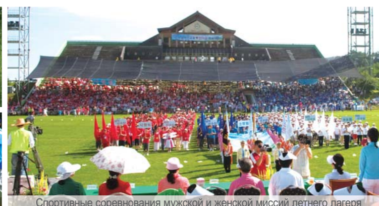
Спортивные соревнования мужской и женской миссий летнего лагеря