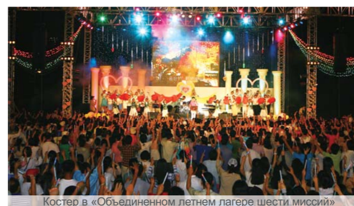
Костер в «Объединенном летнем лагере шести миссий»