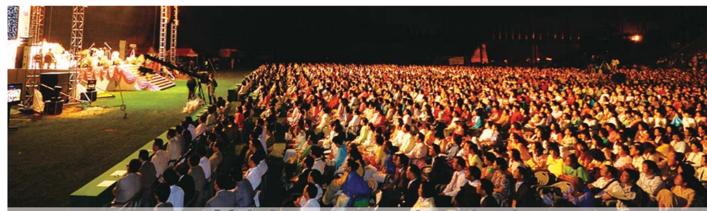
Библейский урок в лагере для мужской и женской миссий