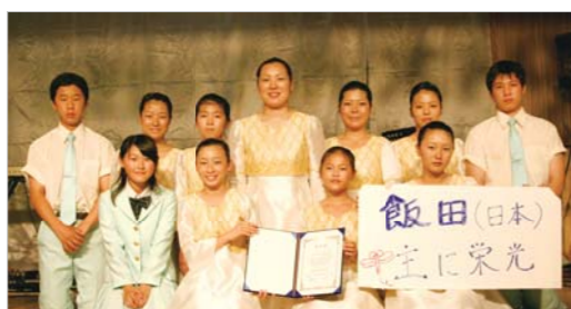
Приз зрительских симпатий на XVI Конкурсе прославления среди студентов