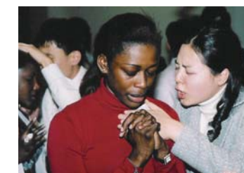
Студенты горячо молятся о спасении души во время своей учебной поездки из руближ