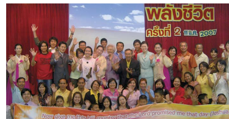
Участники в служении с платком в городе Банкок, Таиланд

До посвящения в миссионеры студенты принимают решение, в какой стране они будут служить, и в какой сфере. С января 1998 года, когда состоялась первая учебная поездка в Японию и Тайвань, студенты УМЦМ направлялись в Западную Африку, Китай, Европу, Россию, Юго-Восточную Азию и Индокитай. Часто эта учебная поездка имеет решающее значение для дальнейшего служения выпускника, где студенты получают возможность познакомиться с духовной, культурной, экономической и общественной ситуацией своей миссии и подготовиться к будущему служению.