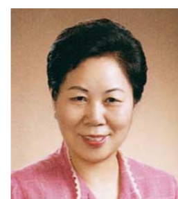
Д-р Эстер Чонг (президент МСМ)

«Ибо земля наполнится познанием славы ГОСПОДА, как воды наполняют море» (Кн. пророка Аввакума, 2:14).