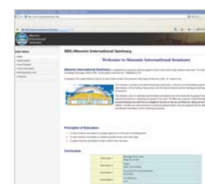
Веб-сайт Международной семинарии Манмин (МСМ)

Штаб-квартира МСМ находится в Сеуле, учебные центры открыты в Бельгии, Великобритании, России, Индии, Китае, на Тайване, в США, Перу и других странах. Студенты также могут проходить обучение в сети Интернет. Зайдите на сайт МСМ по адресу: www.manminseminary.org , зарегистрируйтесь в качестве