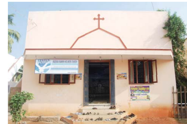
Церковь Мадурай Манмин