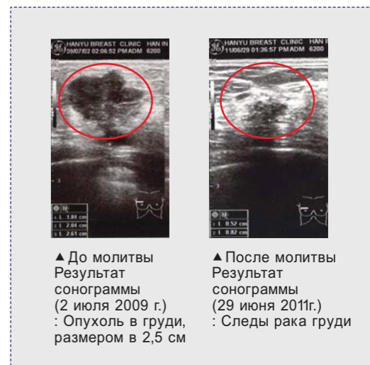
▲ До молитвы Результат сонограммы (2 июля 2009 г.) : Опухоль в груди, размером в 2,5 см

Прошлым маем я обнаружила, что уплотнение, после того как я с верой пожала руку д-ра Ли, стало меньше. 10 июня, во время молитвы на первом Специальном служении Божественного исцеления, опухоль пропала совсем. 24 июня я вновь приняла молитву во время третьего Специального служения Божественного исцеления. Затем, 29 июня, мне сделали повторный тест. Результат теста показал, что у меня нет рака, остались только следы болезни. Аллилуйя!