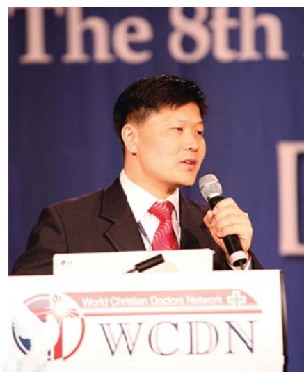
La Red Mundial de Médicos Cristianos (WCDN por sus siglas en inglés) ha verificado que Dios está vivo y que la Biblia es auténtica por medio de datos médicos en casos de sanidad divina.

Desde el año 2004, en calidad de Secretario general de WCDN, he dado muchas presentaciones cada año en varios países en las Conferencias Internacionales de Médicos Cristianos en casos de sanidades divinas, los cuales ocurrieron por el poder de Dios. El pasado mes de junio tuve un momento muy especial al dar una presentación del caso de sanidad de mi propio hijo, en la 8ª Conferencia Internacional de Médicos Cristianos en Australia.