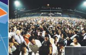
▲ Reunión de Sanidad con el Pañuelo en Papúa Occidental, Indonesia