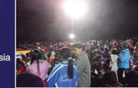
▲ Reunión de Sanidad con el Pañuelo en Tailandia