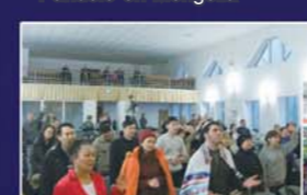
▲ Reunión de Sanidad con el Pañuelo en Kazajstán