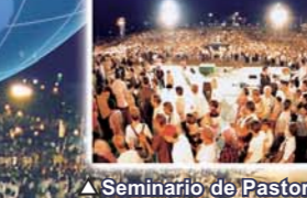
▲ Seminario de Pastores en Sri Lanka