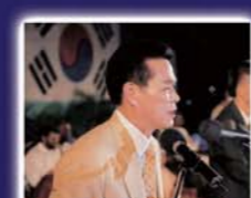
▲ Festival de Oración por Sanidad Milagrosa India 2002 con el Rev. Dr. Jaeroek Lee