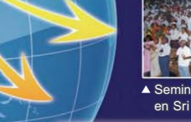
▲ Seminario de Pastores en Sri Lanka