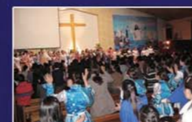
▲ Reunión de Sanidad con el Pañuelo en Mongolia