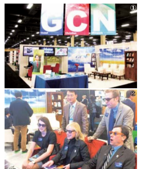
Radiodifusora GCN ha transmitido la Palabra de vida, las poderosas obras de Dios y cultura cristiana de alta calidad a 170 países. ■ Fotografía 1: El puesto de Radiodifusora GCN en la Convención y Exposición de NRB 2012 ■ Fotografía 2: Líderes de NRB miran la presentación en video 3D

más grande del mundo de la fe basada en entretenimiento cristiano, inspiraciones espirituales y contenidos educativos, además de ser una multiplataforma que incluye un servicio de red social y el comercio electrónico. Michael Solomon, su Presidente, propuso una alianza con GCN TV, diciendo: “Me gustaría presentar a toda la audiencia de televidentes en el mundo los sermones del Dr. Lee y otros programas de GCN”. Además GCN TV estableció acuerdos de cooperación y negocios con 15 organismos y grupos de radiodifusión de seis países, incluyendo Life Zone TV de Estados Unidos y SCT Internacional de Brasil. Un obrero de GCN TV indicó: “Pude notar una colaboración activa aquí para ayudar a la globalización de GCN TV. Uniremos a los organismos de radiodifusión cristiana, estableceremos infraestructura que permita que la gente vea los programas en cualquier lugar y construiremos un sistema multilingüe y una red mundial de distribución”.