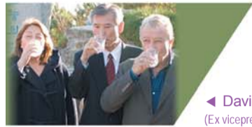
◀ David Waisman (Ex vicepresidente de Perú, a la derecha)