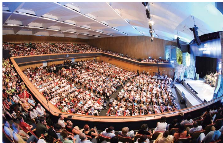
Cruzada Unida Israel 2009 con el Dr. Jaerock Lee

La cruzada se interpretó a ocho idiomas y se transmitió en vivo a través de GCN TV, Enlace, CNL, TBN Rusia y Digital Congo. Además se transmitió por medio de organismos de televisión pública y por redes de televisión por cable y satelital tales como Day Star, Miracle TV, Heaven 7 TV. A través de estos medios la cruzada se transmitió a aproximadamente 220 países. En consecuencia, el evento se percibió como un acontecimiento histórico sin precedentes en la historia cristiana.