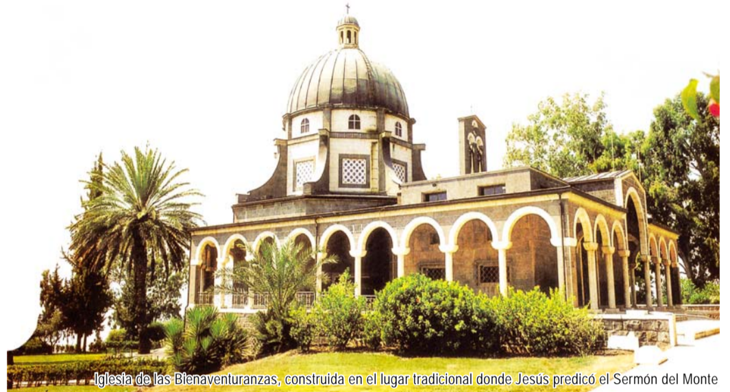
Iglesia de las Bienaventuranzas, construida en el lugar tradicional donde Jesús predicó el Sermón del Monte

En la cima de un monte, Jesús predicó un mensaje precioso a la multitud. A este se lo ha denominado 'El Sermón del Monte'. A las personas que pronto desaparecen como la niebla, Jesús les enseñó acerca de las bendiciones eternas, es decir, las bendiciones verdaderas para entrar al reino de los Cielos. Ese mensaje fue 'Las Bienaventuranzas'. Sirve de señal para que nosotros podamos examinar nuestras vidas para entrar en el lugar donde está el trono de Dios; la Nueva Jerusalén. ¡Ahondemos un poco más en eso!