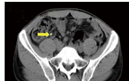
Después de la oración: apéndice normal