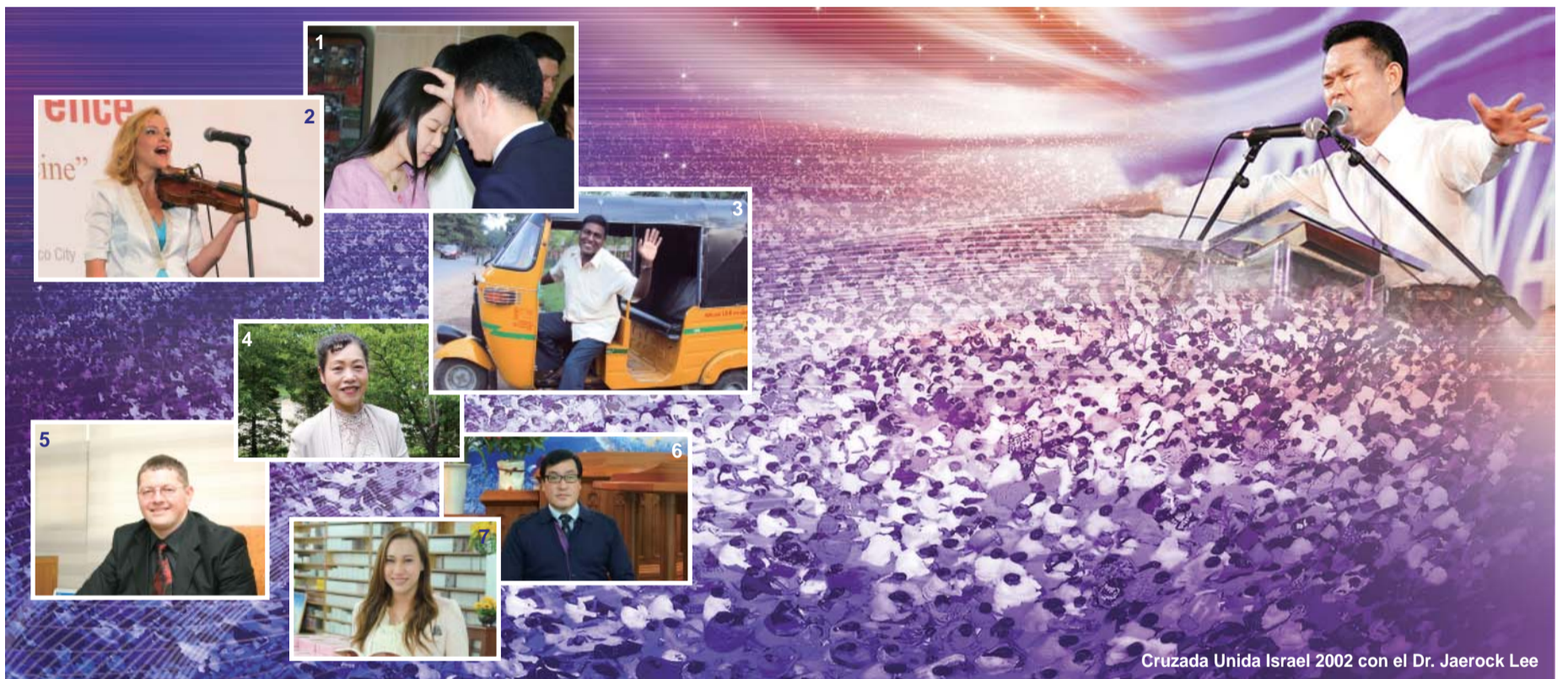
Cruzada Unida Israel 2002 con el Dr. Jaerock Lee

«Y se les aparecieron lenguas repartidas, como de fuego, asentándose sobre cada uno de ellos»