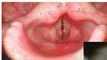
Pólipos en la cuerda vocal derecha causados por el uso excesivo

Dos semanas después, sentí agua en mi cuello y corrí al baño. Cuando lo escupí, era sangre. Esperaba que fuera la respuesta de Dios y fui al hospital. Mi doctor dijo: «Bueno, es casi imposible que los pólipos exploten por sí solos...» y agregó que tuve suerte. ¡Los pólipos de las cuerdas vocales habían desaparecido!