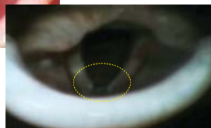
Los pólipos desaparecieron después de la oración