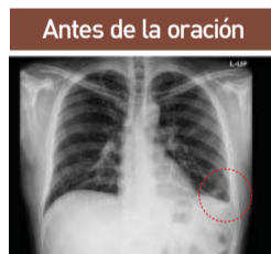
▲ Imagen costofrénica anormal de la cavidad pleural, costillas y diafragma

El 17 de febrero me sometí a otro chequeo médico. El doctor dijo: «No hay neumonía ni pleuresía. No muestra ningún rastro de pleuresía». Dijo que estoy normal. ¡Aleluya!