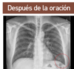
▲ Ángulo costofrénico normal