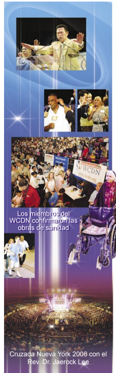
Los miembros del WCDN confirmaron las obras de sanidad

Durante ese tiempo no sabía que ambas palabras estarían conectadas entre sí y que esta Puerta podría ser abierta solamente cuando yo alcanzara la edad de Cristo, ¡- en Enero del 2007 tendré 33 años! +