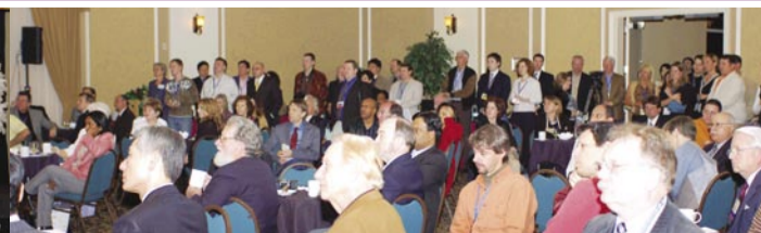
La Recepción de GMA concurrida por más de 200 comunicadores