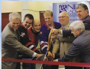
Convención de Inauguración de la NRB