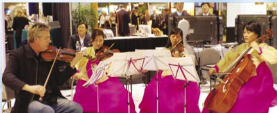
El Cantante y escritor evangelista Don Moen tocando junto con el cuarteto electrónico "Milagro" en el quiosco de Manmin