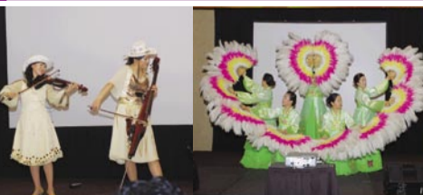
Actuación de "Miracle" y la danza de abanicos