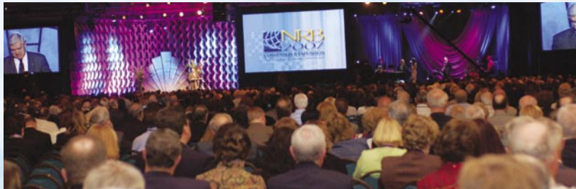
64a Convención de la NRB