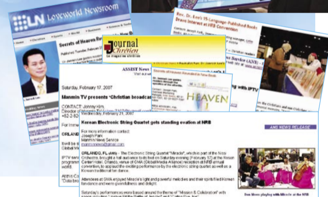
Noticias relacionadas a Manmin TV durante la Convención de la NRB fueron transmitidas en el servicio de Noticias ASSIST, Noticiero Cristiano, de la Red LoveWorld de los E.U. y Journal Chretien de Francia.

El Personal de Manmin TV deja Seúl el Jueves 15 de Febrero del 2007, dirigiéndose a Orlando, Florida; para participar en "La 64a Convención y Exposición Nacional de Presentadores Religiosos (NRB)". Fundado en 1944, la NRB patrocina la Convención y Exposición anual para presentadores Cristianos internacionales y publicistas que buscan promover sus derechos e intercambiar información. El evento de la NRB es el más grande en su clase en todo el mundo.