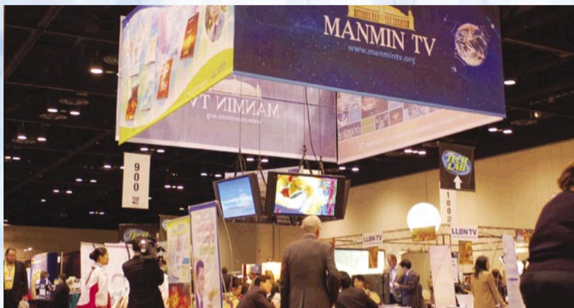
Quiosco de Manmin