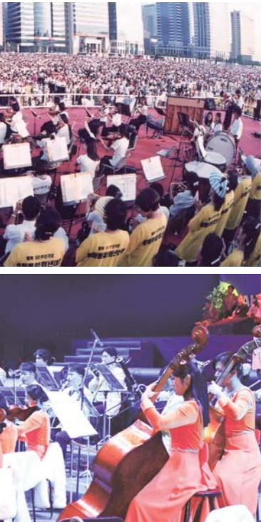
La Orquesta Nissi glorifica a Dios con sus presentaciones en celebraciones navideñas, el “Concierto Feliz”, la Cantata de Pascua, y una variedad de eventos cristianos en Corea y cruzadas internacionales.