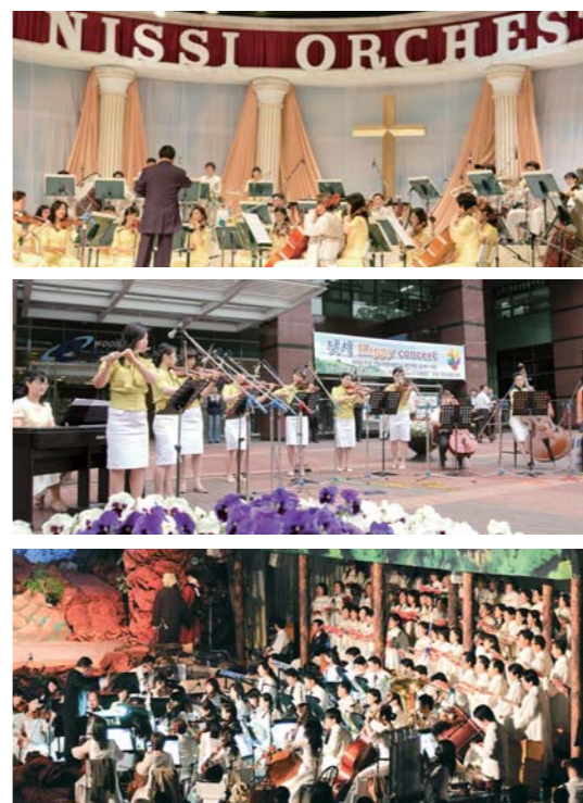
La Orquesta Nissi glorifica a Dios con sus presentaciones en celebraciones navideñas, el “Concierto Feliz”, la Cantata de Pascua, y una variedad de eventos cristianos en Corea y cruzadas internacionales.

Ejecuciones que inspiran, miembros unidos en amor y fe