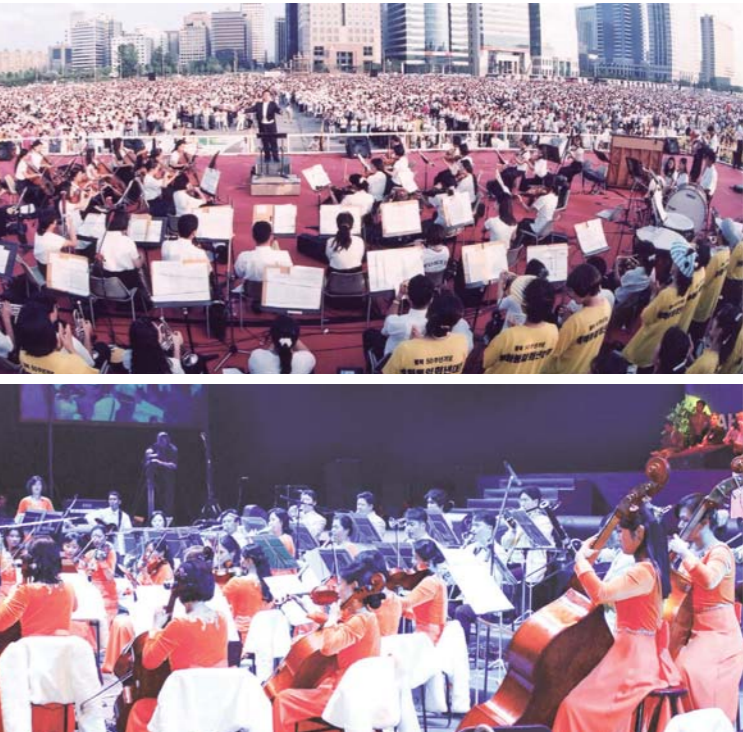
La Orquesta Nissi glorifica a Dios con sus presentaciones en celebraciones navideñas, el “Concierto Feliz”, la Cantata de Pascua, y una variedad de eventos cristianos en Corea y cruzadas internacionales.