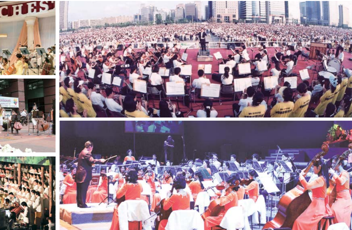
La Orquesta Nissi glorifica a Dios con sus presentaciones en celebraciones navideñas, el “Concierto Feliz”, la Cantata de Pascua, y una variedad de eventos cristianos en Corea y cruzadas internacionales.