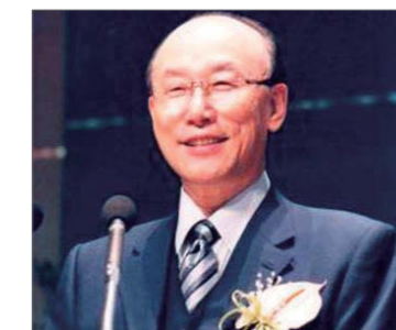
Yonggi Cho Pastor del año

El líder principal del Ministerio MorningStar tomó el papel de árbitro y mentor espiritual de Todd Bentley, quien dejó el ministerio en el 2008, tras el escándalo a raíz del divorcio con su primera esposa. En el video de la entrevista que Rick Joyner tuvo con Todd y su nueva esposa, él trató de demostrar la raíz del problema que sucedió con el joven ministro y enseñar a otros cristianos a escapar de tales problemas en el futuro.