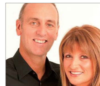
Brian Huston Personalidad de Medios del año

El Pastor de la famosa Iglesia Saddleback de los EE. UU. se convirtió en uno de los protagonistas favoritos de la prensa del año 2009. Él dirigió la oración durante la toma de posesión del Presidente Obama, y se levantó en defensa de la protección de los valores cristianos en los Estados Unidos. A diferencia de otros ministros cristianos, su nombre apareció con mayor frecuencia en los titulares de los noticieros.