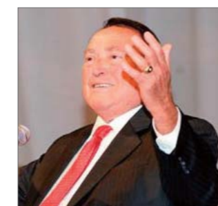
Morris Cerrullo evangelista del año

Uno de los escritores cristianos más famosos entró en una red social popular en Internet en el 2009. Ahora tiene más oportunidades de compartir los principios de una vida cristiana exitosa. Sus libros siguen influenciando a un gran número de personas en todo el mundo, sin importar si son cristianas o no.