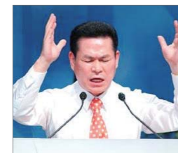
Jaerock Lee evangelista televisivo del año

Este evangelista, cuyo nombre ha sido conocido en todo el mundo, visitó los países de la antigua URSS en el 2009. Durante sus seminarios con pastores y líderes cristianos, el evangelista compartió secretos para un evangelismo exitoso. Morris Cerrullo llegó con su nieto, quien se hizo cargo del ministerio de su abuelo.