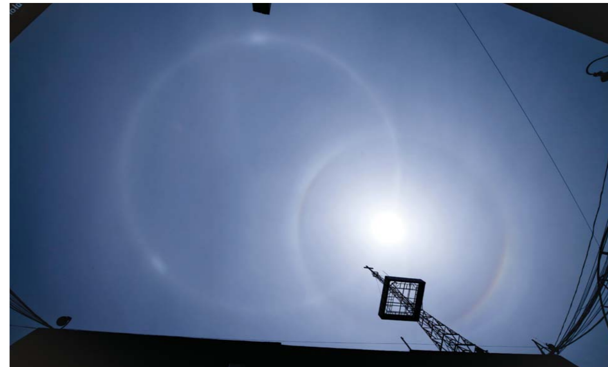
EOS 5D Mark II | Sigma 12-24mm | 1/500 s | F18 | ISO100 | 2010-04-14 11:31:19.

Simbolizado por el cumplimiento del Pacto de Dios, en la forma de un anillo destacado con un diamante