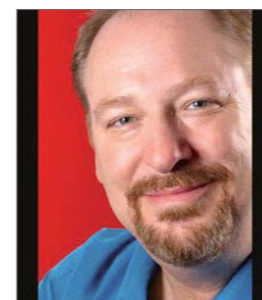
Rick Warren figura más importante del año

El Pastor de la famosa Iglesia Saddleback de los EE. UU. se convirtió en uno de los protagonistas favoritos de la prensa del año 2009. Él dirigió la oración durante la toma de posesión del Presidente Obama, y se levantó en defensa de la protección de los valores cristianos en los Estados Unidos. A diferencia de otros ministros cristianos, su nombre apareció con mayor frecuencia en los titulares de los noticieros.