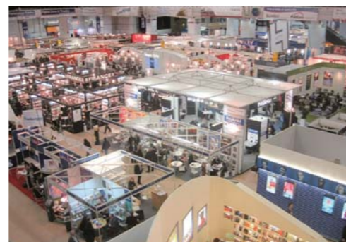
La 39na Feria Anual del Libro en Londres, realizada en Earls Court, Londres, del 19 al 21 de abril.