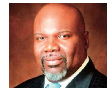
T.D. Jakes predicador del año

Pastor de una mega iglesia en Seúl, Corea del Sur, le dio mucha importancia al desarrollo del ministerio de la televisión en su iglesia en el año 2009. Incluso en las iglesias filiales de Manmin se transmiten los sermones del Pastor Lee desde la Iglesia Central durante los servicios locales. Con la colaboración de Canal TBN, la Iglesia Manmin realizó una gran cruzada en Israel, la cual miles de cristianos en Israel, así como del resto del mundo, tuvieron la oportunidad de observar por medio de la televisión.