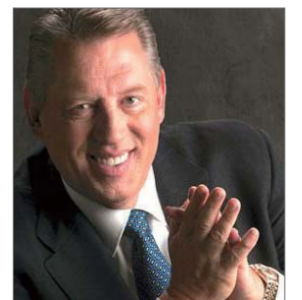
John Maxwell motivador del año

Pastor de la iglesia más grande del mundo, con sede en Seúl, Corea del Sur, celebró una gran conferencia para pastores. Miles de líderes cristianos de todo el mundo llegaron a formar parte de la conferencia. A pesar de su edad, Yonggi Cho continúa edificando su iglesia y también enseña a los pastores de todo el mundo a edificar ministerios afectivos y de crecimiento.