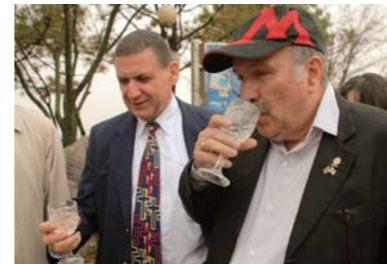
▲ Bebiendo el Agua Dulce de Muan en el lugar del milagro del Agua Dulce de Muan.

Cuando tomé el Agua Dulce de Muan, tenía un sabor fresco y bueno. El agua estaba un poco fría, pero ore por buena salud y poder espiritual, y me sumergí en el Agua Dulce de Muan siete veces por fe. Mientras me sumergía, sentí una paz indescriptible y la presencia de Dios. Catorce años atrás yo recibí medicación debido a un dolor fuerte en mi rodilla derecha. Durante los últimos cuatro años el dolor fue aún más fuerte, y debía tener mucho cuidado y pedir ayuda a los demás para subir escaleras. El doctor me recomendó que hiciera ejercicio físico y que perdiera peso para no sobrecargar a mis huesos, y que me apoyara en un bastón. Pero yo creí en el poder sanador de Dios y caminaba con paciencia a pesar del dolor. Luego de sumergirme dentro del Agua Dulce de Muan, no sentí dolor en mi rodilla mientras conversaba con diferentes personas sentadas en el suelo. Me sorprendí tanto que comencé a mover mis piernas y me arrodillé en el suelo. Tenía que sentir el dolor y mis rodillas anteriormente temblaban, pero ahora ya no sentía dolor y pude subir escaleras libremente. Por lo tanto, he experimentado el poder de Dios que se encuentra en el Agua Dulce de Muan.