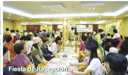
Fiesta de Recepción