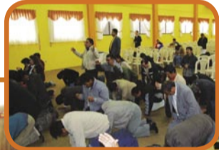
Reunión de oración en Bolivia