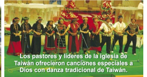
Los pastores y líderes de la iglesia de Taiwán ofrecieron canciones especiales a Dios con danza tradicional de Taiwán.