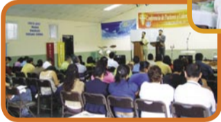
Conferencia de Pastores en Costa Rica