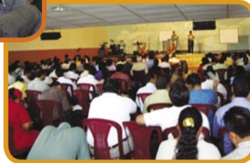
Conferencia de Pastores en Nicaragua