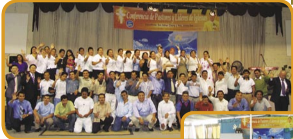
Conferencia de Pastores en Guatemala