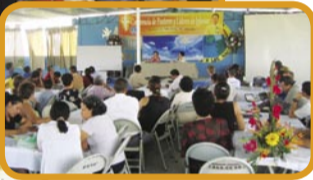
Conferencia de Pastores en El Salvador