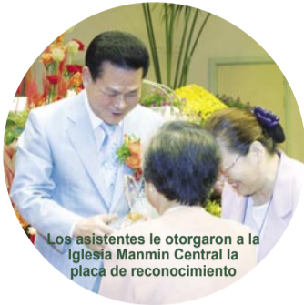
Los asistentes le otorgaron a la Iglesia Manmin Central la placa de reconocimiento

El Sr. Kim también visitó la Estación de Transmisión Cristiana de Australia y discutió sobre la posibilidad del intercambio de programas de televisión del ministerio.