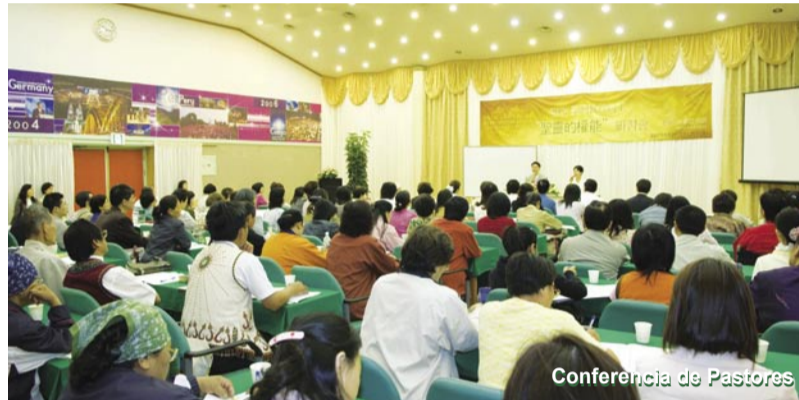
Conferencia de Pastores

85 pastores y líderes de la iglesia de Taiwán asistieron y renovaron sus corazones por el avivamiento.