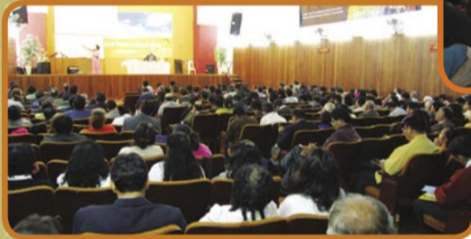
Conferencia de Pastores en Lima, Perú