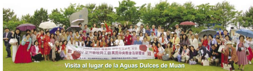
Visita al lugar de la Aguas Dulces de Muan