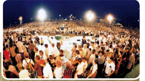
2001 이재록 목사 필리핀 연합 대성회