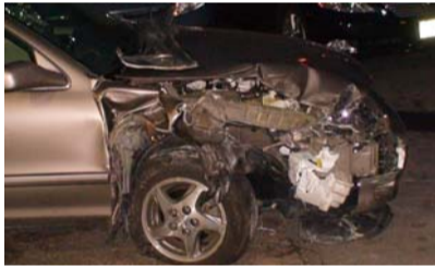
당시 사고 차량

잠시 후 정신을 차려 보니 조수석 앞 우리는 거미줄처럼 깨져 있고 차 안은 만신창이가 되어 있었습니다. 차 바퀴는 모두 찢기고 차체 앞은 종이를 마구 구겨 놓은 듯 했으며, 차 앞 뚜껑은 떨어져나가 흉하게 부서진 부분을 드러내고 있었지요. 분주히 오가는 경찰차와 앰블런스, 들것에 실려 이송되는 부상자들... 그 상황에서 서도 어머니와 저는 떨었습니다.