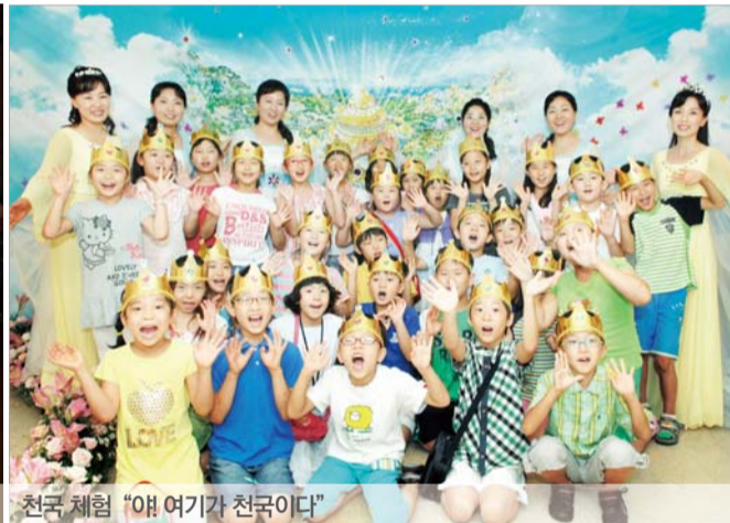
천국 체험 '애 여기가 천국이다'