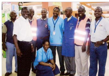
나쿠마트 직원들과 함께

나쿠마트는 경영주가 인도인이기 때문에 주일에도 영업을 합니다. 그러나 이재록 목사가 총재로 계시는 빛과 소금교회(주일에도 근무해야 하는 유통업과 요식업 종사자를 위한 초교파 선교단체)를 본받아 나쿠마트 직원 복음화에 전력할 것입니다. 역경 많았던 제 삶에 넘치는 축복을 주신 하나님께 감사드립니다.