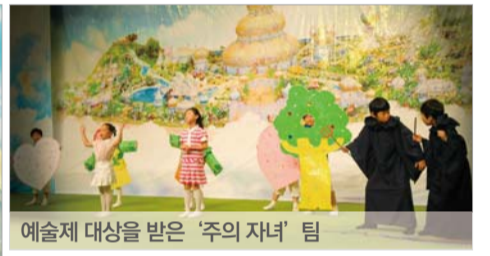
예술제 대상을 받은 '주의 자녀' 팀