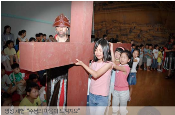
영성 체험 '주님의 마음이 느껴져요'