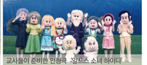
교사들이 준비한 인형극 '알프스 소녀 하이디'