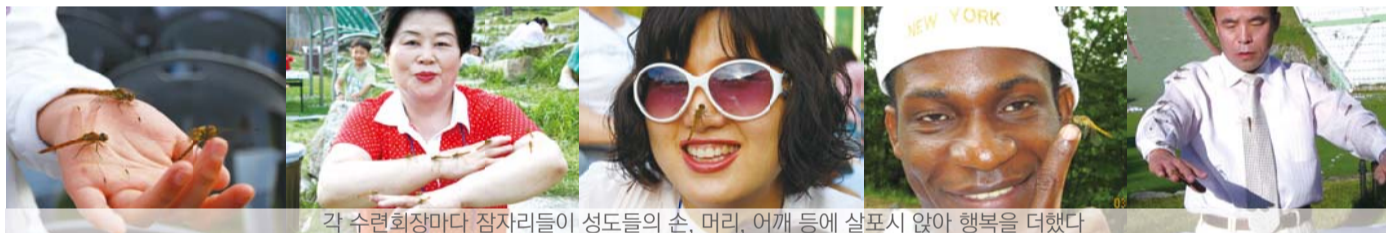
각 수련회장마다 잠자리들이 성도들의 손, 머리, 어깨 등에 살포시 앉아 행복을 더했다