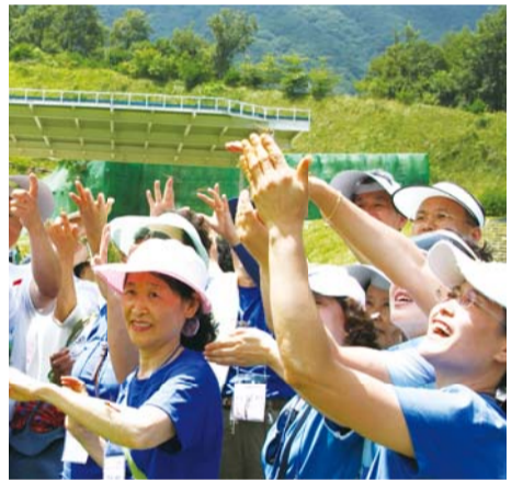
손끝에 앉은 잠자리를 보며 행복해하는 성도들