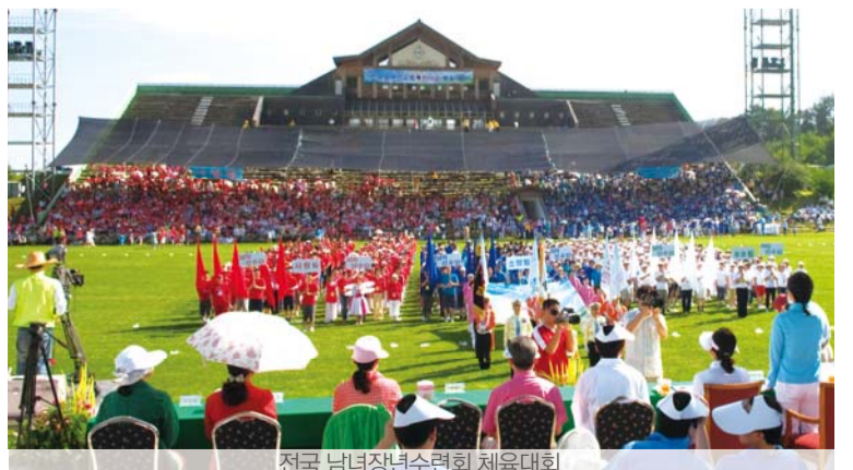
전국 남녀장년수련회 체육대회