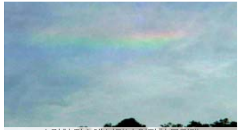
수련회 장소에 나타난 일자형 무지개