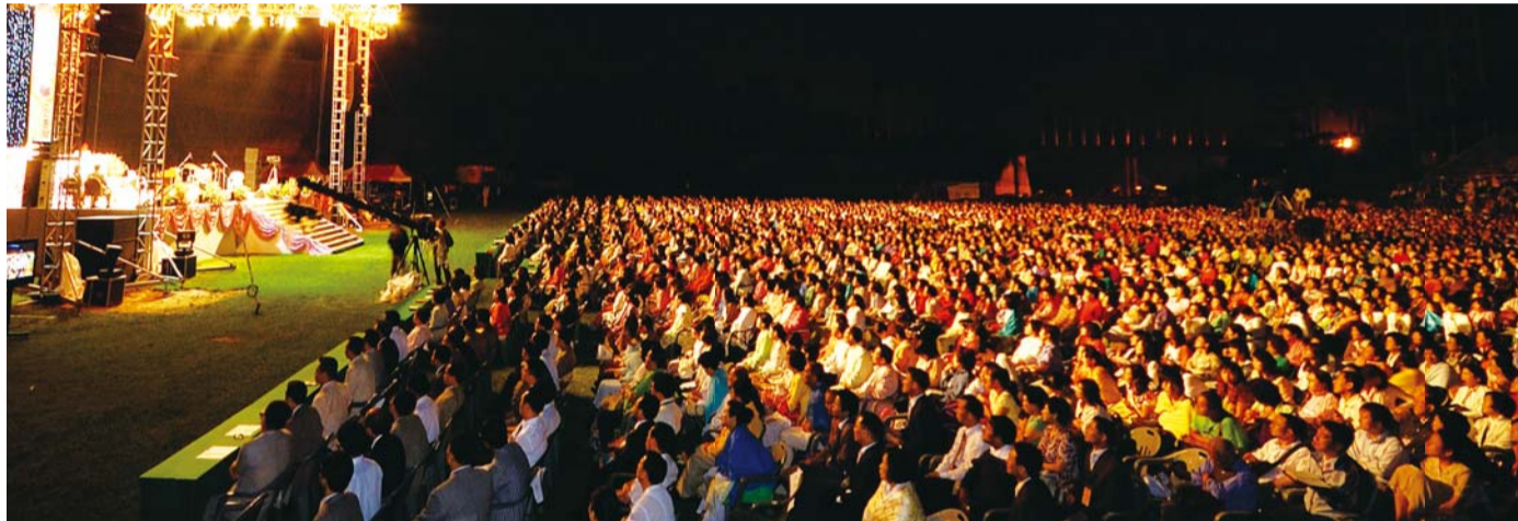
전국 남녀장년수련회 교육