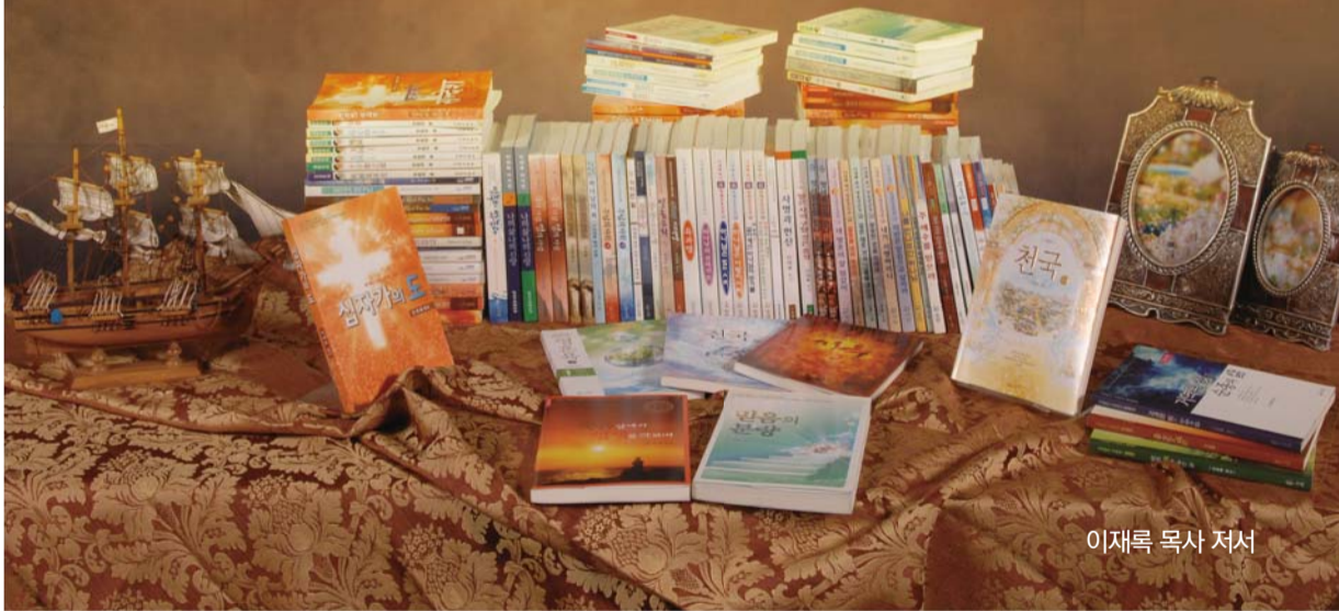
이재록 목사 저서