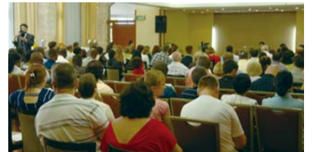
예루살렘 지역에서 개최된 제3차 목회자 세미나

“제가 목회자 세미나를 마치고 숙소로 돌아가려고 할 때, 목사님 한 분이 저에게 차를 세우고 잠깐만 기다려 달라고 요청을 하셨습니다. 암환자 한 분이 저를 만나기 위해 먼