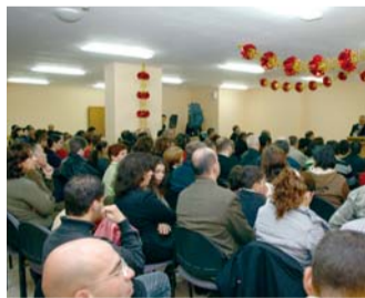
예수님이 탄생하신 베들레헴 지역에서 인도한

“예루살렘은 이스라엘의 수도이지요. 유 대교의 핵심 지역이며 가장 많은 수의 정통 유대인이 사는 곳입니다. 이러한 예루살렘 의 가장 중심지역에서 집회를 열게 된 것입 니다. 이 교회 목사님은 성령의 역사와 치