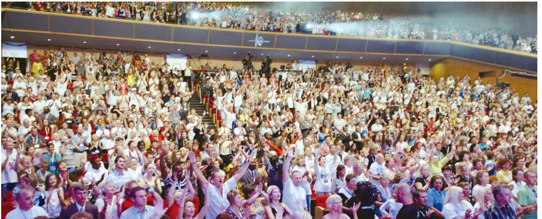
36개 국에서 참석한 교회 지도자들과 성도들이 공연팀과 함께 찬양하며 환호하고 있다

9월 6-7일, 예루살렘 ICC(국제컨벤션센터)에서 크리스털 포럼 주최로 열린 '이재록 목사 초청 이스라엘 연합성회' 후에도 치료와 응답의 간증이 끊임없이 접수되고 있다.