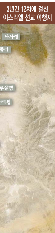
3년간 12차에 걸친 이스라엘 선교 여행지