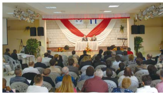
나사렛 지역에서 개최된 제2차 목회자 세미나

곳에서 택시를 타고 오고 있다는 것이었지요. 잠시 후 그분이 도착했고 저는 간절히 기도해 주었습니다. 그런데 그때 저에게 기도를 받은 분이 암을 깨끗이 치료받은 것입니다. 바로 이런 역사들이 일어나기 때문에 저를 신뢰하며 참믿음을 갖게 되었고, 우리와 협력해 복음 전파에 힘쓰고 있는 것입니다. 최근에는 저를 더 신뢰하고 믿음이 커질 수 있는 또 한 가지 계기가 생겼습니다. 그것은 바로 저에게 기도를 받은 손수건(행 19:11-12)을 통해 나타나는 하나님의 역사를 직접 체험하고 있다는 것입니다.”