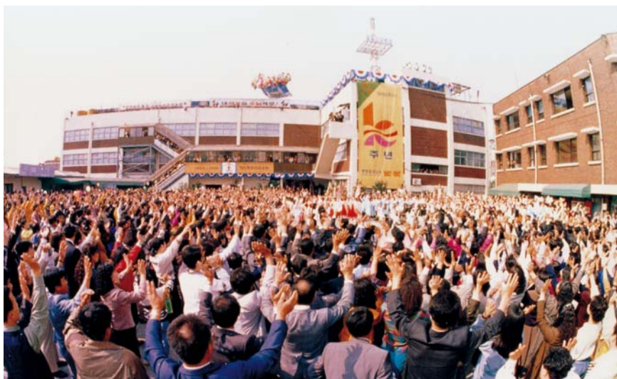
교회 창립 10년 만에 등록교인 1만 7천 명의 대교회로 성장했다. 창립 10주년 기념 야외행사(1992.10.11.)

초대교회 같은 부흥을 더하며 하나님 축복이 넘쳐나던 1989년, 교회는 한 차례 어려움에 직면한다. 근거 없는 모함으로 목사 파직과 교회 제명이라는 위기를 겪게 되었다. 여기에 하나님의 놀라운 지혜가 숨겨져 있었다. 1991년 7월, 새로운 교단을 형성하여 민족복음화와 세계 선교를 위해 마음껏 일할 수 있게 된 것이다.