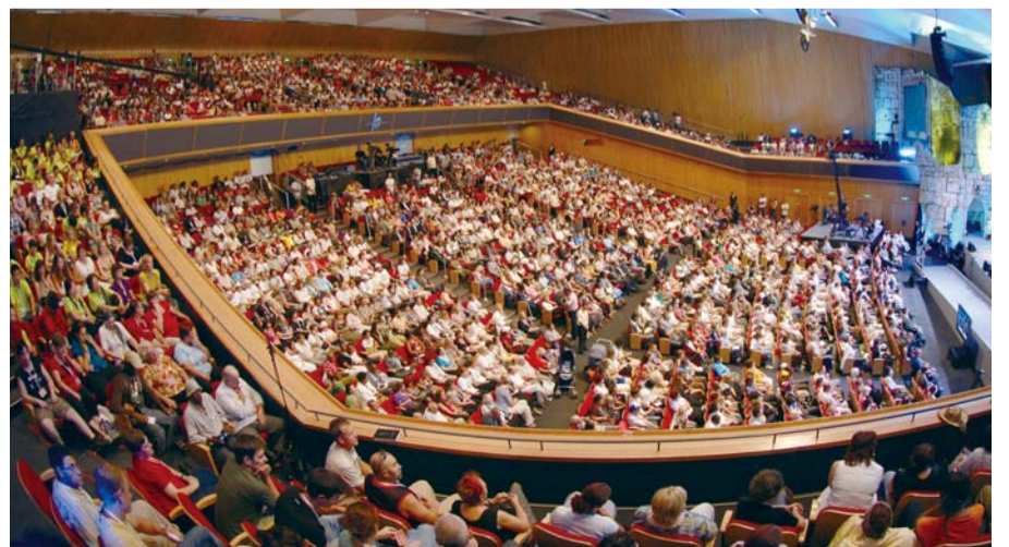
2009 이스라엘 연합성회는 33개 방송사에서 220여 개국에 8개 국어로 방송되었다(CC)

(편집자 주 : 이상의 내용은 이재록 목사가 2007년 8월 5일부터 2009년 9월 20일까지 주일 예배 설교시간에 행한 ‘이스라엘 선교보고’를 직접 채록한 것입니다)