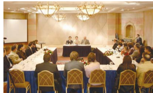
3차 이스라엘 선교를 위한 베들레헴 목회자 모임