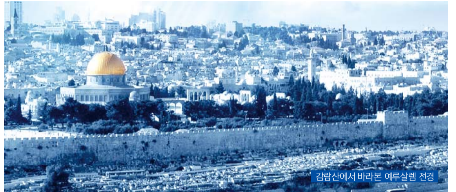
김광산에서 바라본 예루살렘 전경