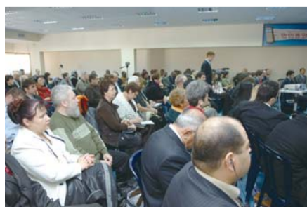
아쉬도트 지역에서 개최된 제4차 목회자 세미나

“2007년 1차 선교 방문 때만 해도 대부분 목회자들이 주중에는 일을 하고, 안식일에만 목회를 하는 형편이었습니다. 이런 상황에서 목회자들이 연합하여 힘을 낸다는 것은 너무나 어려운 일이고 복음 전파를 위해 교회들이 연합하여 어떤 일을 계획하여 실행한다는 것은 엄두도 내기 어려운 형편이었지요. 그런데 저를 믿고 신뢰하며 우리 만민과 함께하기를 너무나 사모하는 목회자들을 중심으로 크리스털 포럼이 결성된 것입니다. 이 모임에 참여한 분들은 단순한 동역자의 관