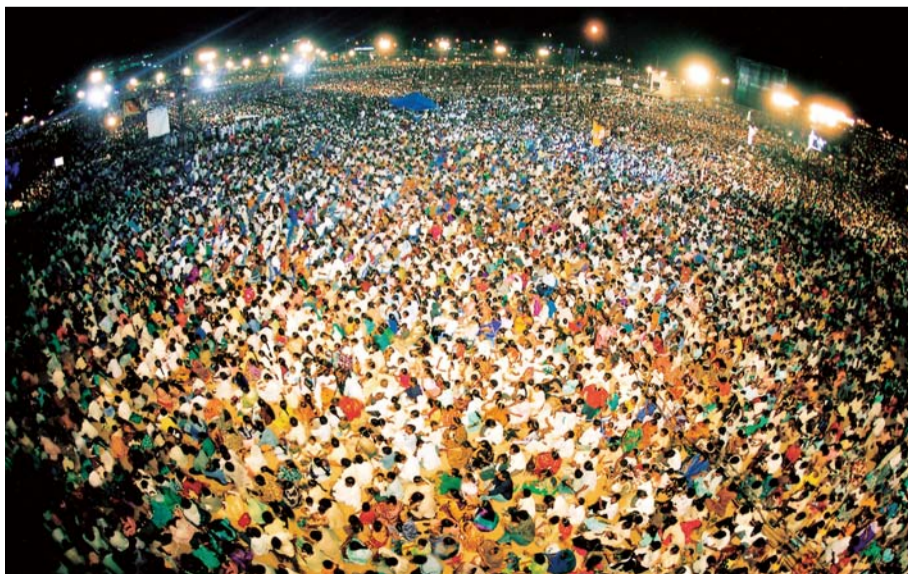
연인원 300만 명 이상이 운집한 인도 연합대성회(2002.10.10-13, 마리나 해변)

2000년 10월, 이슬람 국가 파키스탄에 성령 복음이 울려 퍼지고 땅끝 이스라엘까지 복음을 전하기 위한 중동 선교의 문이 열렸다.