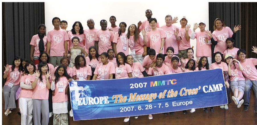
십자가의 도 유럽 캠프를 마치고 현지 캠프 참석자들과 훈련생들이 함께하고 있다

세계 각지에서의 비전 트립(Vision Trip)을 통한 선교지 개척, 선교사 파송, 문서 선교, 세미나, ‘십자가의 도 캠프’ 등 다양한 선교 콘텐츠로 세계 선교의 협력 네트워크를 구축해 가고 있다. 이러한 프로그램은 크게 이론과 실기로 구성되어 있다. 선교에 필요한 다양한 교육과 성경 말씀을 정립시키며, 실제적인 선교 활동을 경험할 수 있다. 더 나아가 세계 교구를 목표로 뜨거운 도약을 준비하고 있다.