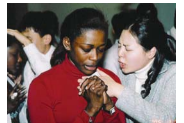
훈련생들이 비전트립 기간 중 현지 성도를 위해 간절히 기도해 주고 있다