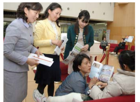
지난 4월 27일, 우리 교회 12-1교구 1지역 일꾼들이 병원을 방문해 ‘만민뉴스’와 ‘만민 투데이’를 가지고 전도하고 있다.

복음을 전하는 사람이 있어야 들을 수 있기 때문에 전도는 그만큼 중요하다(롬 10:14). 구원받을 수 있는 사람이 복음을 듣지 못해 지옥에 간다면 얼마나 안타까운 일인가? 그런데 어떤 사람들은 “바빠서 전도할 시간이 없어요. 성격상 남에게 말을 못해요” 한다. 그러나 전도는 해도 되고, 안 해도 되는 선택 사항이 아니다. 전도는 주님의 지상명령이자 우리의 사명이기 때문이다.