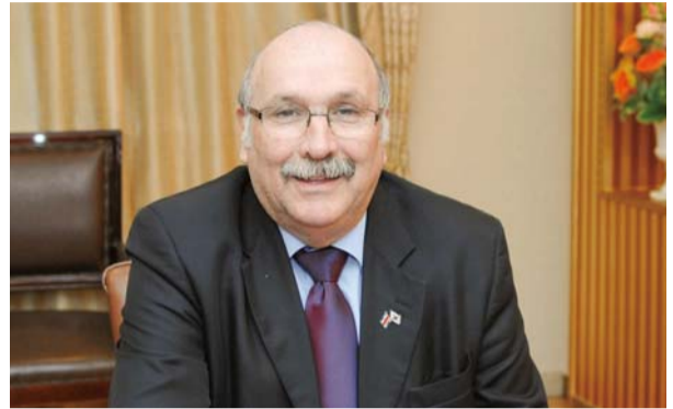
구온 올트 마세이 모라 목사 (코스타리카 국회의원)

기도받기를 사모해 참석했지요. 원장님은 한 사람 한 사람 권능의 손수건(행 19:11-12)으로 기도해 주셨습니다. 성전 이곳저곳에서 통회자복의 역사가 일어났지요. 드디어 원장님의 기도의 손길이 제 어깨에 닿았습니다. “아버지! 이 아들에게 통회자복의 은혜를 주셔서 치료받게 하옵소서” 순간 눈을 감고 있는 상태에서 눈앞에 환한 빛이 비추는 것이 아납니까. 저는 그만 알차고 하염없이 회개와 감사의 눈물을 흘렸습니다. 기도를 받은 뒤 마음이 날아갈 듯 가볍고 개운했습니다. 곧이어 저는 허리를 돌려보고 다리를 들어 올려봤지만 아무 통증이 없었습니다. 이를 뒤, 서울대 병원에서 엑스레이 촬영 결과, 허리에 전혀 이상이 없으니 수술할 필요가 없다는 것이었습니다. 할렐루야!