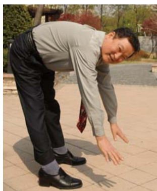
이렇게 허리를 굽힐 수 있어서 너무 행복합니다

저는 회사에서 무거운 쇠붙이 등을 취급하다보니 허리 디스크 협착증에 걸렸습니다. 이로 인해 매일 허리와 다리에 통증이 심해 견딜 수 없었지요. 마음 한 구석에 낙담도 되고, 거동할 수조차 없는 날이 계속 되자 결국 서울대 병원을 찾았습니다. 검진 결과, 수술을 해야 한다고 했습니다. 하지만 아내와 근근이 벌어서 생활하는 뼈뺀 살림에 수술할 엄두가 나지 않았지요. 통증은 더해만 갔고, 진통제로 통증을 이겨내야만 했습니다. 정진영 교구장님은 2회 연속 특별 다니엘철야 때 하나님께 매달려 믿음으로 치료받기를 권면하시면서 먼저 지난날의 잘못을 회개해야 한다고 말씀하셨습니다. 지난 3월, 2회 연속 특별 다니엘철야가 한창이던 어느 날이었습니다. 말씀에 대한 사모함이 없었으며, 생활이 어렵다는