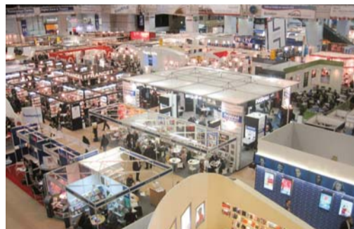
지난 4월 19일부터 21일까지 영국 런던 Earls Court 전시장에서 열린 ‘런던 국제도서전’ 전경