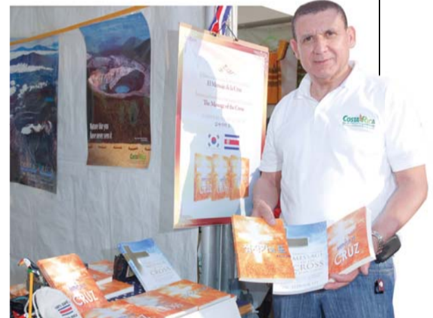
‘2010 서울 지구촌 한마당’ 행사에서 주한 코스타리카 페르난도 보르본 대사가 코스타리카 부스에 당회장 이재록 목사 저서 『십자가의 도』를 전시, 홍보하고 있다.

5월 8일, 주한 코스타리카 페르난도 보르본 대사는 코스타리카 부스에 ‘코스타리카에서 가장 많이 읽힌 한국 책으로 『십자가의 도』 한국어, 스페인어, 영어 판을 전시하여 많은 방문객에게 홍보했다.