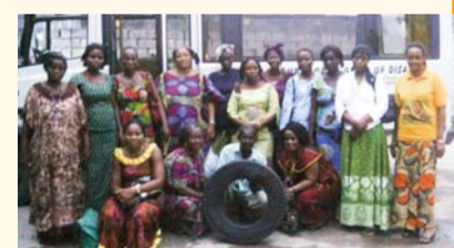
버스 한쪽의 뒷바퀴 2개가 튕겨나간 위험한 상황에서도 보호받은 성도들

버스를 타고 있던 성도들은 그 누구도 두려워하지 않고 목자의 하나님을 의지하며 한마음 한뜻으로 기도드렸다고 합니다. 그 때 하나님의 도우심으로 제어할 수 없었던 버스가 안전하게 도로 한쪽에 정차해 대형사고에서 보호받을 수 있었던 것입니다.