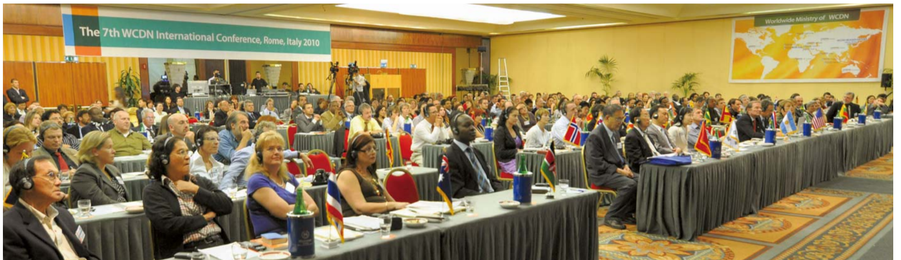
지난 5월 21일과 22일, WCDN(세계기독교사네트워크)이 주최한 제7회 국제기독교의학콘퍼런스가 이태리 로마 쉐라톤 호텔 콘퍼런스 센터에서 '영성과 의학'을 주제로 열렸다.

이태리 로마 WCDN 국제의학콘퍼런스, 전 세계 40개국 270여명 참석