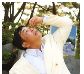
무안단물터를 눈에 넣어 왼쪽 눈의 심한 난시를 치료받았다.

지금 그들은 건강과 물질의 축복도 받아 행복한 신앙생활을 하고 있습니다. 이러한 하나님 역사를 저 또한 체험하고 있으니 사역하는 것이 즐겁고 행복합니다.