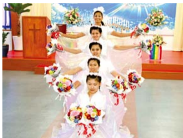
공트와 특송으로 하나님께 영광돌리는 페낭 농아만민교회 성도들