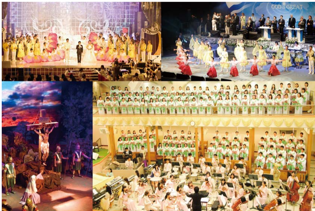
우리 교회 예능위원회는 예배는 물론 각종 행사와 해외 성회 시 하나님께 영광 돌리고 있다.

예능위원회에는 흰돌(아동), 나사렛(학생), 임마누엘(청년), 샬롬(장년) 성가대와 금빛 합창단(여성)의 5개 성가대와 국내 유일 찬양 전문 오케스트라인 닛시오케스트라, 그리고 할렐루야선교단, 파워워십팀, 크리스탈싱어즈, 빛의소리중창단, 예술선교단, 사랑울동단, 새렘국악선교단, 피아노 6중주, 금관앙상블 등 찬양, 무용, 연주팀과 솔리스트, 만민스텝을 포함해 23개의 예능팀으로 구성되어 있다.