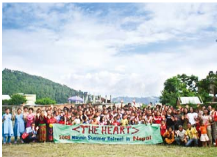
작년 8월에 열린, 네팔 지교회 연합수련회

작년 하반기에 목회자 세미나 및 손수건 집회 인도차 네팔 서부 고르카 투미 지역을 간 적이 있습니다. 버스가 더 이상 올라갈 수가 없어 중간에 내려 걸어갔습니다. 저와 선교센터 직원 한 자매는 20권이 넘는 『십자가의 도』 책자와 네팔어 '만민뉴스', 권능 DVD 등 선교자료들을 잔뜩 짊어지고 산길을 여덟 시간 이상 올라간 적도 있지요. 하지만 그 누구도 힘들다 하지 않았습니다. 이외에도 여러 난관이 닥칠 때마다 하나님께서 힘과 능력을 주시기 때문에 행복합니다.