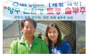
SBS 모닝와이드 리포터와 함께

지난 6월, 양주시 고읍 신도시에서 우수 농축산물 판매행사가 있었습니다. 그 때 장태평 농림식품부장관께서 저의 판매장을 방문하여 부추 가공식품을 시식한 후 칭찬과 격려를 아끼지 않으셨습니다. 이처럼 하나님께서는 제 영혼이 잘되는 만큼 하나하나 축복의 길로 인도해 주셨습니다.