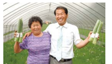
무지개 뜨는 농장에서 어머니와 함께