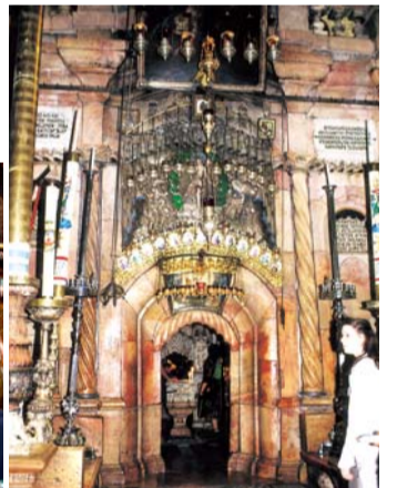
제14처소 아리마대 요셉이 무덤에 장사지낸 곳