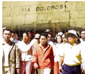
비아도로로사 십자가를 지고 가신 수난의 길

라틴어로 비아도로로사(Via Dolorosa)라고 하는 '십자가의 길'은 '슬픔의 길', '수난의 길'로 불리기도 한다. 예수님이 본디오 빌라도에게 재판을 받은 곳으로부터 십자가를 지고 골고다 언덕을 향해 걸었던 약 800m의 길과 골고다 언덕에서 십자가 처형에 이르기까지의 전 과정을 의미한다.