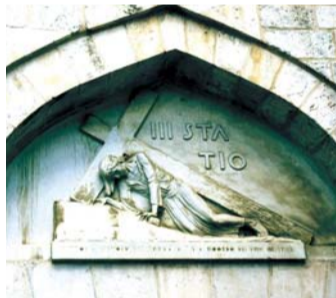
제3처소 십자가를 지고 가다 처음 쓰러지신 곳