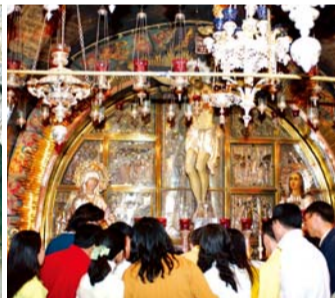
제12처소 십자가 위에서 운명하신 곳