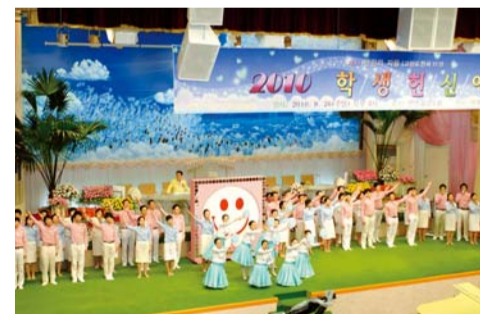
‘2010 학생주일학교 헌신예배’에서 학생주일학교 지도교사, 부장, 선교회장단이 단에 올라 특송하고 있다.

지난 9월 26일 오후 3시 주일저녁예배 시 우리 교회 본당에서 2010 학생주일학교 헌신예배를 드렸다. 강사로 선 당회장 이재록 목사는 ‘만민의 사랑’(고전 11:1)이라는 제목으로 “믿음과 소망, 선과 사랑으로 생각하면 어려운 현실도 극복하고 하나님 능력으로 영광 돌릴 수 있다”며 “세상 것이 튼타지 않도록 마음을 지키고 진리로 무장하며, 범사에 성실로 식물을 삼을 것”을 헌신자들에게 당부했다.