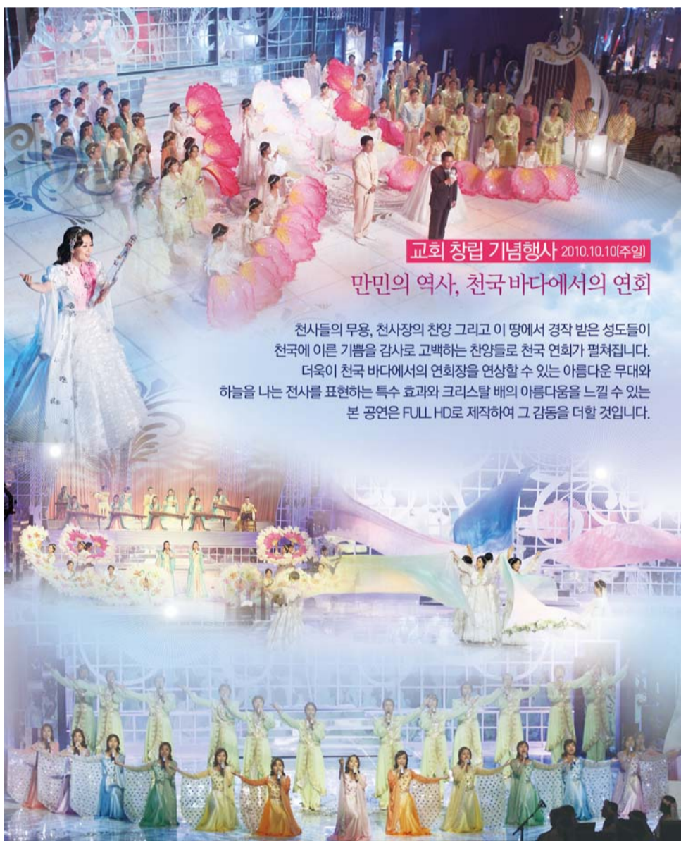
교회 창립 기념행사 2010.10.10(주일)