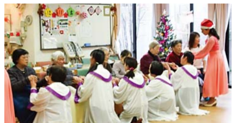
노인들과 함께 찬양을 부르는 마이즈루 만민교회 성도들

성가대가 크리스마스 캐럴을 부르자 노인들의 굳었던 얼굴이 밝아지고, 천사복장을 한 학생부 워십팀의 찬양에 이곳저곳에서 감동의 박수가 터져 나왔다. 예수님의 탄생과 그 의미에 대해서 알려 준 뒤, 답소를 나누며 정성껏 준비한 선물을 드렸다. 노인들은 눈시울을 적시며 성도들의 따뜻한 사랑에 감사의 마음을 전했다.