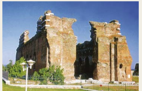
버가모 교회 유적