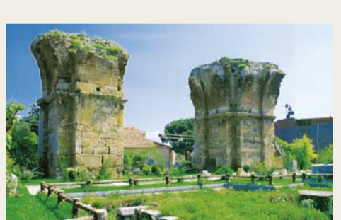
빌라델비아 교회 유적