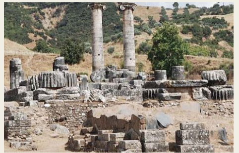
서머나 교회 유적