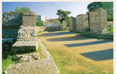
두아디라 교회 유적