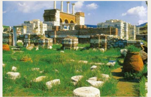
에베소 교회 유적

사랑하는 성도 여러분, 지금까지 살펴본 일곱 교회와 같은 교회들은 물론, 성도들도 많이 있습니다. 일곱 교회에 하신 말씀을 되새겨 보고 신앙 상태를 점검해 보는 지혜가 필요한 때입니다. 그러므로 빌라델비아 교회와 같이 적은 능력을 가지고도 하나님의 말씀을 지키며 칭찬받는 교회, 칭찬받는 성도가 되시기를 주님의 이름으로 축원합니다.