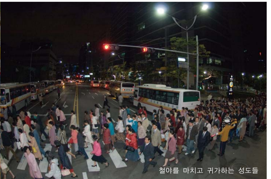
철야를 마치고 귀가하는 성도들